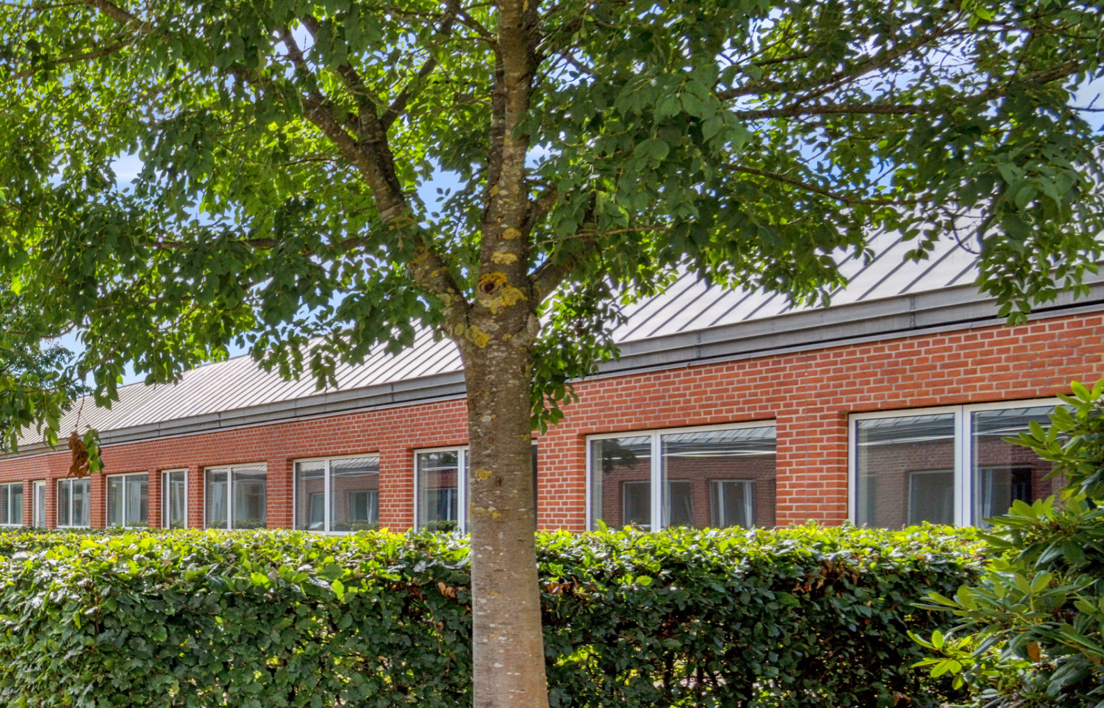
Ejendommen set udefra