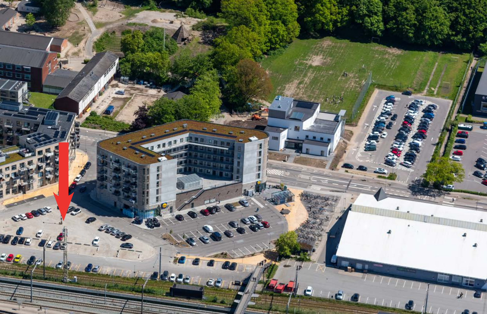
Luftfoto samt volumenstudie